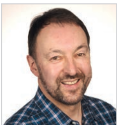
Von Peter Schenk

Fluglärm macht krank! Die lebensverkürzenden Auswirkungen auf die Menschen in Mainz und der Region können nicht ignoriert werden. Uns bleibt Protest und Widerstand, und den wollen wir stärken.