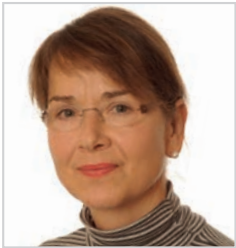
Von Ingrid Pannhorst

Der Sommer 2018 hat Deutschlands Städte durch Hitze und Trockenheit im Wechsel mit Starkregenereignissen und Stürmen in Atem gehalten. Forscher erwarten künftig häufiger Hitzewellen, die länger und intensiver ausfallen. Die Städte müssen sich dringend an die Klimaveränderung anpassen – auch Mainz.