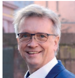
Von Thomas Mann

Bürgerentscheid zum Gutenberg-Museum: Das Ergebnis hat deutlich gezeigt, wie stark eine Mehrheit im Stadtrat sich vom Bürgerwillen entfernt hatte. Unsere Reaktion darauf kann nur sein, direkt-demokratische Beteiligungsformen zu stärken.